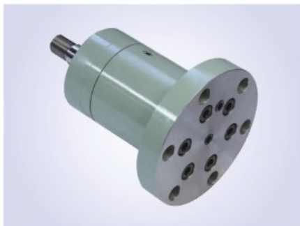
CP型FBタイプ 丸フランジ (P053参照)