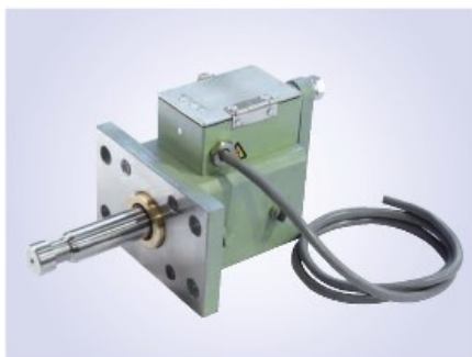
BC型FA両軸タイプ (P075参照) 付属品: MS / J型アーム