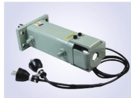
リードスイッチ保護カバー BCC型リードスイッチ内蔵タイプに取付 *コード先のコネクタはオプション対応になります