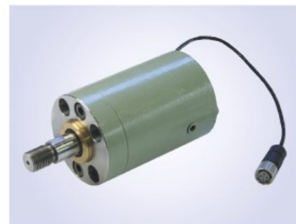
MMCII型スリーブセンサ内蔵タイプ (P105参照)