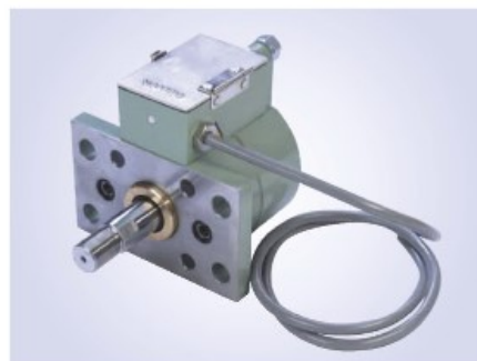
DC型FA両軸タイプ (P113参照) 付属品: MS / J型アーム