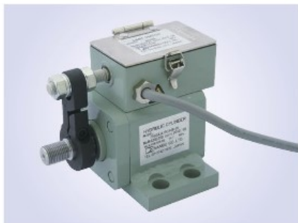
BC型LAタイプ (P075参照) 付属品: MS / J型アーム