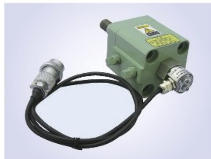
MCII型リードスイッチ内蔵タイプ (P091参照) *コード先のコネクタはオプション対応になります