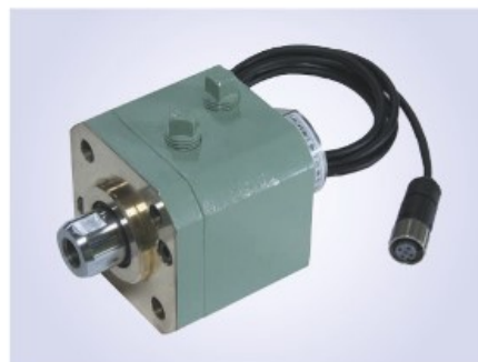
EXS型磁歪センサ内蔵タイプ (P099参照)